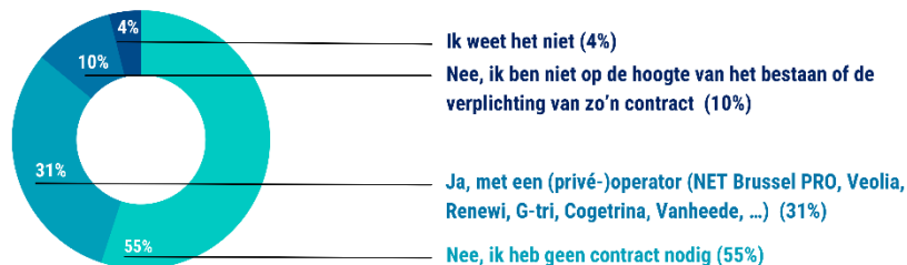
Grafiek: Beschikt u over een contract voor afvalophaling? (één keuze) (alle sectoren, n=345)

Voor bijna een kwart van de respondenten (23%) is de rolcontainer het middel bij uitstek om afval in te zamelen/sorteren . Ongeveer 65% van de ondernemers geeft echter aan niet genoeg afvalstoffen te hebben om een dergelijke container te vullen (in het bijzonder in de dienstensector en andere sectoren). Hoewel meer dan de helft van de ondervraagde ondernemers (56%) van mening is dat de hoeveelheid afvalstoffen die zij produceren stabiel is gebleven, moet worden opgemerkt dat 39% van hen een daling vaststelt van de hoeveelheid afvalstoffen die hen aanbelangt.